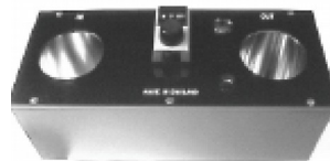
Figura 2.- Aparato de Radionica

tintura original de sepia, sino que la oscilación correspondiente (en calidad de portador de la información) se crea directamente en un aparato de radiónica especialmente concebido para ello. Esta característica ha hecho que los aparatos de radiónica se extiendan especialmente en aquellos países cuya débil infraestructura, también en el campo de la Sanidad, no siempre permite acercarse de forma natural a la farmacia más cercana, tanto por motivos de distancia como por la situación financiera de los afectados. Aquí hay que citar India, África y América del Sur, y cabe destacar que la difusión de la radiónica es especialmente amplia en las antiguas colonias inglesas.